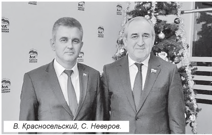
В. Красносельский, С. Неверов.

Президент ПМР Вадим Красносельский провел на этой неделе масштабный визит в Российскую Федерацию. В ходе рабочих контактов глава государства провел встречи в Администрации президента РФ, в Госдуме, Совете Федерации, представительстве Приднестровья в Москве.