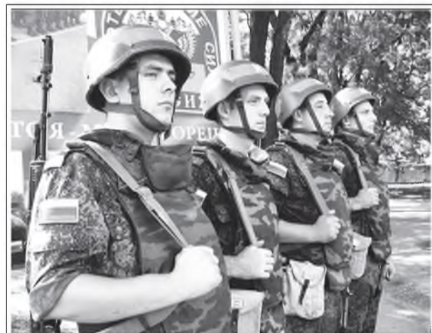
Уважаемые приднестровцы! Уважаемые военнослужащие Миротворческих сил Российской Федерации!

25 лет прошло с момента ввода миротворческих сил Российской Федерации в Приднестровье. Все это время мир в регионе поддерживается благодаря реализации одной из самых действенных мирогарантийных операций в истории под эгидой России.