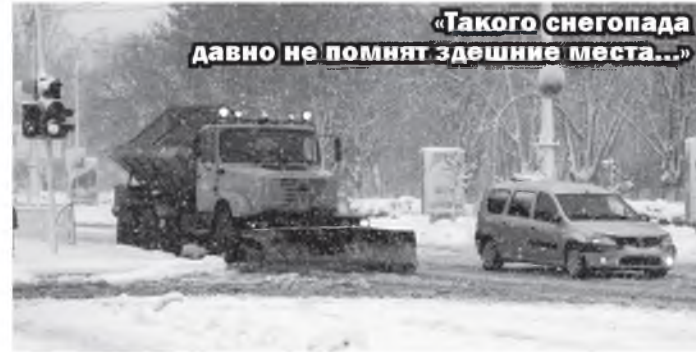
«Такого снегопада давно не помнят здешние места...»

Штормовое предупреждение по всему Приднестровью объявили заранее. 27 января пришло время решительно противодействовать разбушевавшейся стихии. На дороги всех городов и районов республики, включая Тирасполь, вышла снегоуборочная техника. К сожалению, во многих местах снег прибывал гораздо быстрее, чем его успевали убирать. Утром 28 января министр внутренних дел ПМР Руслан Мова доложил главе государства Вадиму Красносельскому, что движение транспорта между населенными пунктами затруднено, местами ограничено, даже некоторые междугородные маршруты временно остановились. Поступило немало тревожных сообщений из разных концов республики о попавших в снежные ловушки автомобилях. Им на помощь приходили спасатели из министерства обороны и управления по чрезвычайным ситуациям. В Тирасполе они освободили из снежного плена четыре застрявшие машины. Легковой автомобиль, съехавший в кювет, вытаскивали с помощью эвакуатора. На улице Одесской вернули на расчищенную дорогу грузовой