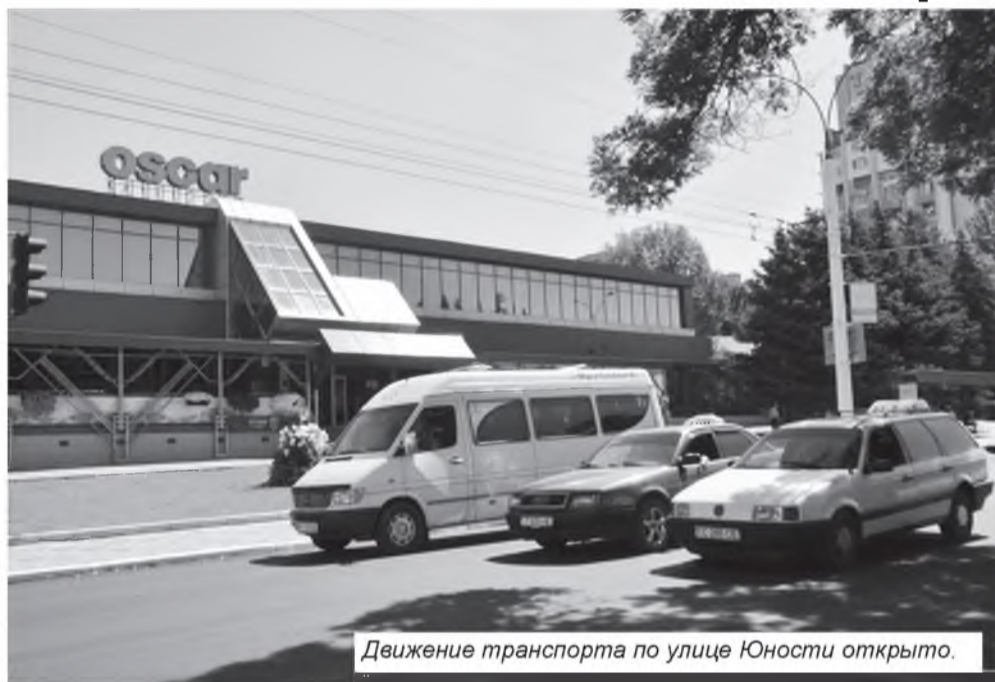
Движение транспорта по улице Юности открыто.

В госадминистрации снова говорили: проблема с чистотой на улицах города остаётся актуальной, в первую очередь по вине самих жителей столицы. Стихийные свалки бытовых и растительных отходов, строительного мусора в разных районах города возникают регулярно и зачастую сразу после уборки территории работниками МУП «Спецавтохозяй-